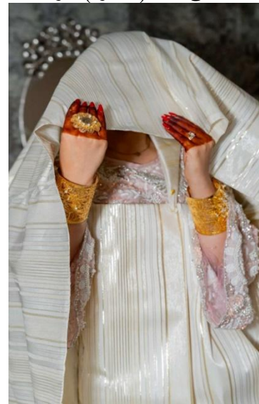
شكل حنة الجلوة