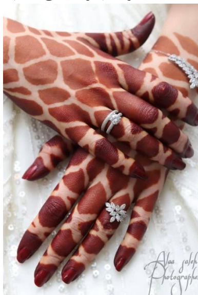
شكل حنة الشبور