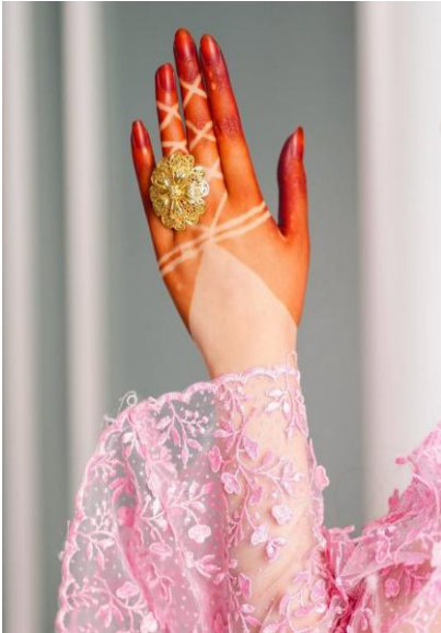
شكل حنة الخطيفة

لعل التخضيب بالحناء ليس فعلا للتجميل وانما هو طقس لتفعيل سلسلة من الرموز المرتبطة بالحماية والبركة والتحول فالشكل المرسوم على جسد العروس في طقس الحناء لا يعد مجرد زخرفة تجميلية او تقليد جمالي بل هو ترميز سيميائي مشحون بدلالات جغرافية وروحية تتحكم فيه التقاليد المحلية وانماط الاعتقاد والذاكرة الثقافية الموروثة لكل جماعة محلية فالحناء سواء رسمت بنمط ( الشبور ) او ( الخطيفة ) او ( الجلوة ) كما هي موضحة في النماذج ادناه انما هي تعيد تشكيل الجسد الانثوي وفق رموز تنتمي الى انظمة مقدسة قديمة تستعاد شعائريا داخل طقوس العرس وتعمل بطريقة تؤدي وظيفة وقائية ولجلب البركة ايضا، ففي مناطق مثل ( زليطن ومصراته وسرت ) تغلب اشكال الحناء الشبور حيث ترسم على اليدين والقدمين مثلثات متكررة ذات شكل المعين اما في المنطقة الساحلية الوسطى فيغلب فيها رسم الحنة على شكل ( الخطيفة ) وهي شكل يتميز برسم يحاكي اجنحة ( طائر الخطيفة ) بحيث ترسم اثنان من المثلثات الطولية بشكل افقي على ظاهر اليدين وباطنهما اما رسم الحنة على شكل ( الجلوة ) فهو نمط تعرف به الحناء الطرابلسية والمناطق الجبلية.